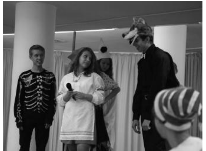
Впервые спектакль для первоклассников был сыгран не в здании на 5-ом Монетчиковском переулке, а на Садовнической набережной в структурном подразделении № 2 (1.09)