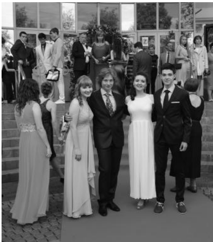
Выпускники 2014 года на красной ковровой дорожке (Выпускной вечер, 20.06)