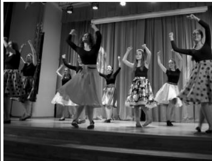
Зажигательный танец девчонок из 9 "В" (Выпускной 9-х классов, 18.06)