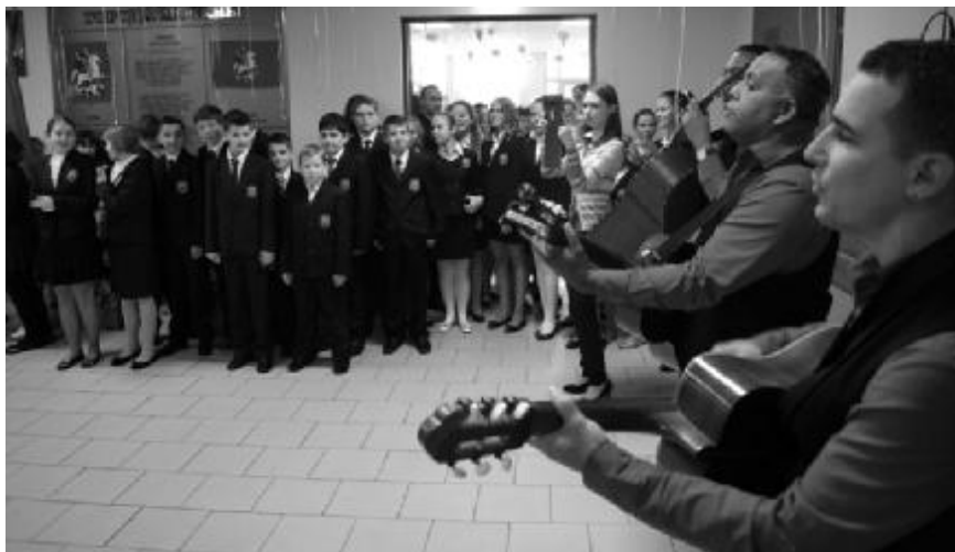
Живая бразильская музыка на открытии бразильского ресторана