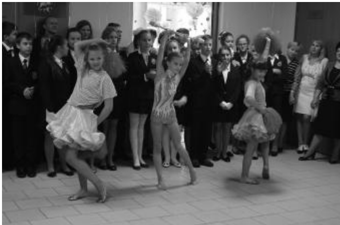
Зажигательные бразильские танцы на открытии новой столовой (1.09)