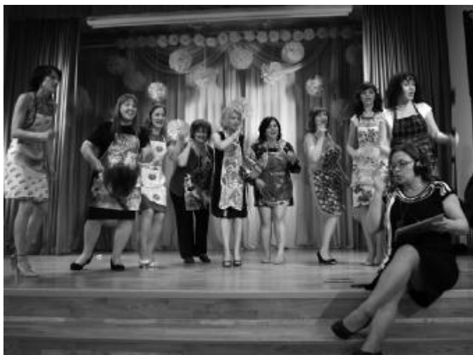
Родители одиннадцатиклассников устроили на выпускном вечере феерическое шоу (20.06)