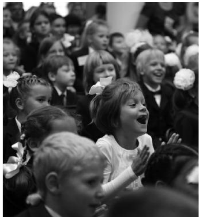
Первоклассники радуются спектаклю (1.09)