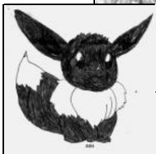
Рисунок неизвестного автора

Рубрику ведут ЛЕНА ШЕПУНОВА и МАША АВДОНИЮШКИНА (10 кл.)